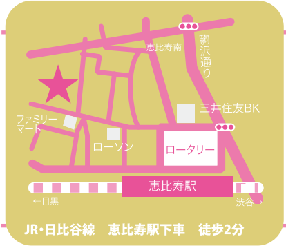
JR・日比谷線 恵比寿駅下車 徒歩2分